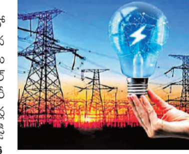
మగతా 2వ పేజీలో..