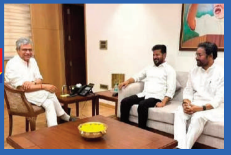
మగతా 2వ పేజీలో..