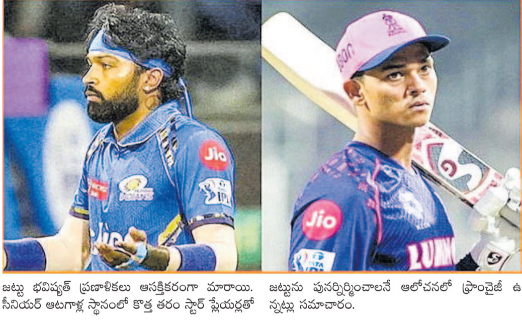
జట్టు భవిష్యత్ ప్రణాళికలు ఆసక్తికరంగా మారాయి. జట్టును పునర్నిర్మించాలనే ఆలోచనలో ఫ్రాంచైజీ ఉ సీనియర్ ఆటగాళ్ల స్థానంలో కొత్త తరం స్టార్ ప్లేయర్లతో స్పృహ సమాచారం.

ముంబై, జూన్ 22 : ఐపీఎల్లో అత్యంత విజయవంతమైన ఫ్రాంచైజీలలో ఒకటైన ముంబై ఇండియన్స్ జట్టులో భారీ మార్పులు జరగనున్నాయనే ఊహాగానాలు క్రికెట్ పర్యాటక చర్చనీయంకంగా మారాయి. జట్టు కెప్టెన్గా ఉన్న స్టార్ ఆల్రౌండర్ హార్దిక్ పాండ్యా జట్టును వీడే అవకాశం ఉందని వార్తలు వినిపిస్తున్నాయి. అతని నాయకత్వంలో జట్టు ఆశించిన స్థాయిలో రాణించలేక పోవడం, డ్రైవింగ్ రూమ్లో అసంతృప్తి పెరగడం వంటి కారణాలు ఈ నిర్ణయానికి దారితీసినట్లు చెబుతున్నారు. అతని స్థానంలో రాజస్థాన్ రాయల్స్ యువ ఓపెనర్ యశస్వి జైస్వాల్ను ట్రేడ్ ద్వారా తీసుకురావాలని ముంబై యాజమాన్యం ప్రయత్నిస్తున్నట్లు సమాచారం. రాజస్థాన్ జట్టులో ఇటీవల అతని పాత్రపై అనిశ్చితి ఉండటంతో ఈ మార్పు చర్చకు వచ్చింది. అదే సమయంలో స్టార్ బ్యాటర్ సూర్యకుమార్ యాదవ్ కూడా ముంబై ఇండియన్స్ను వీడే అలోచనలో ఉన్నాడని ఊహాగానాలు వినిపిస్తున్నాయి. కొత్త జట్టు నుంచి అతనికి కెప్టెన్సీ అఫర్లు కూడా ఉన్నట్లు తెలుస్తోంది. ఈ పరిణామాల మధ్య ముంబై ఇండియన్స్