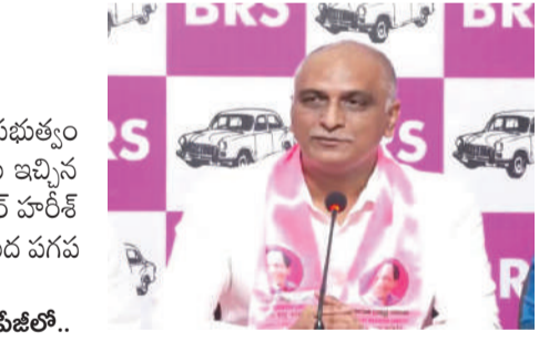
మగతా 2వ పేజీలో..