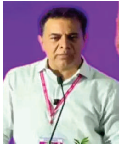
మగతా 2వ పేజీలో..