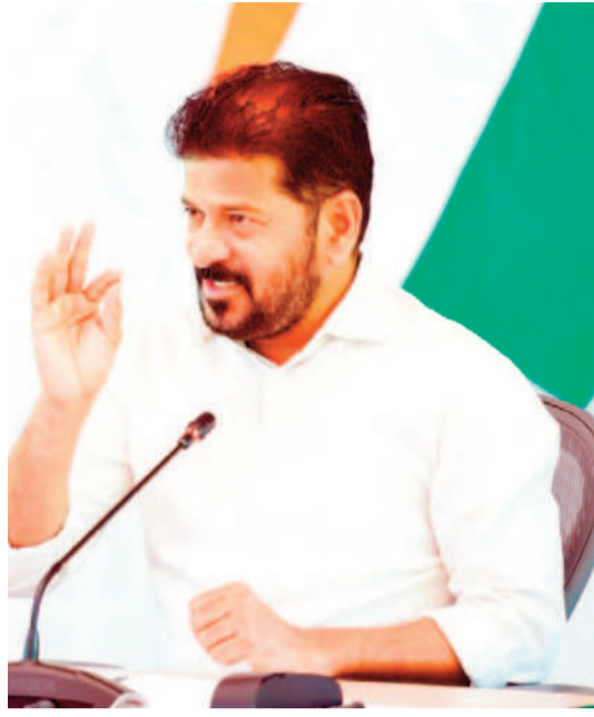
అవసరమైతే కిషన్ రెడ్డితో వ్యక్తిగత భేటీకి కూడా తాను సిద్ధమేనని రేవంత్ ఆ లేఖలో పేర్కొన్నారు.

హైదరాబాద్ మెట్రో రైలు అంశంపై ఇదే నెల 16వ తేదీన కూడా కిషన్ రెడ్డికి సీఎం రేవంత్ లేఖ రాశారు. ఈ సమస్య పరిష్కారానికి ఏ సమావేశానికైనా తాను సిద్ధమేనని అందులో స్పష్టం చేశారు. రైల్వే మంత్రితో వీలైనంత త్వరగా సమావేశం ఏర్పాటు చేయాలని కోరారు. ఆ సమావేశానికి సంబంధించి కిషన్ రెడ్డి పిలుపు కోసం తాను ఎదురుచూస్తానని తెలిపారు. ఈ ప్రాజెక్టు కోసం