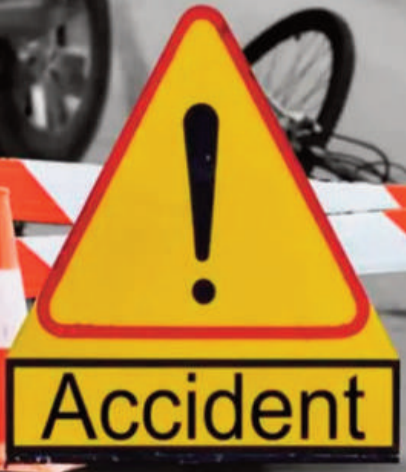
అక్కడికక్కడే మృతిచెందారు. మరో ముగ్గురు గాయపడ్డారు. కారులో ప్రయాణిస్తున్న వారిది జగితలూరుగా తెలుస్తోంది. ఘటనపై సమాచారం అందుకున్న పోలీసులు ఘటనాస్థలికి చేరుకుని పరిశీలించారు. క్షతగాతులను చికిత్స నిమిత్తం ప్రభుత్వ ఆస్పత్రికి తరలించారు.