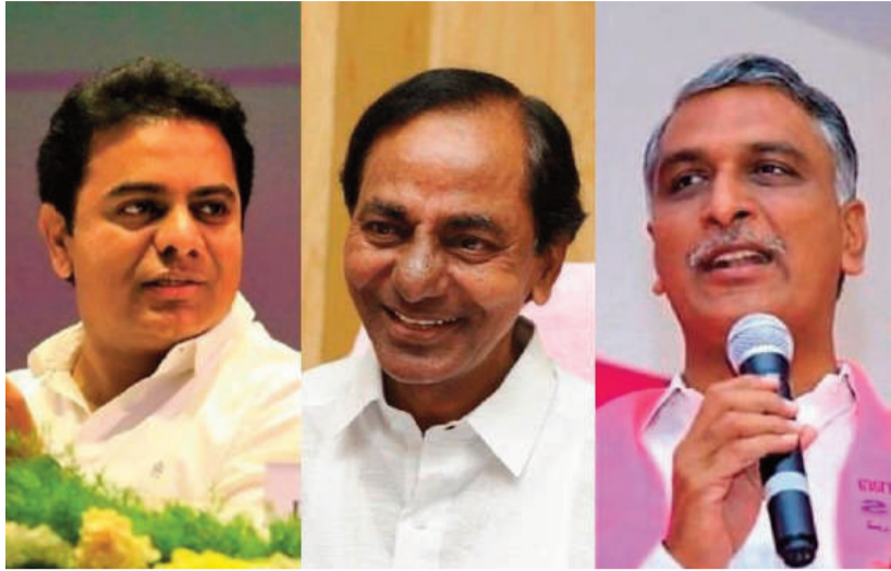
విస్తృతంగా చర్చించినట్లు పార్టీ వర్గాలు పేర్కొన్నాయి. రాజోయే స్థానిక సంస్థల ఎన్నికలు, ముఖ్యంగా జీవోఎంసీ ఎన్నికలను దృష్టిలో ఉంచుకుని