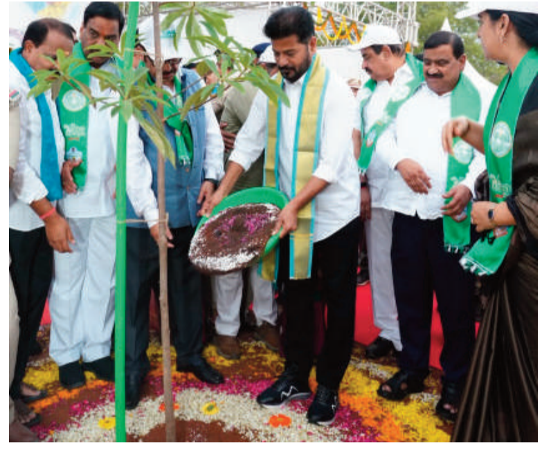
మిగతా 2వ పేజీలో..

రంగారెడ్డి, జూన్ 18 (రాజముద్ర న్యూస్): ఎవరైనా ప్రభుత్వ భూములను కబ్జా చేయాలని చూస్తే కఠిన చర్యలు తీసుకుంటామని తెలంగాణ ముఖ్యమంత్రి రేవంత్ రెడ్డి హెచ్చరించారు. కబ్జాలతో ప్రజలకు సమస్యలు రాకూడదనే హైద్రా తీసుకువచ్చామని ప్రస్తావించారు. హైద్రాను ఒక భూతంలా కొందరు చూపెడుతున్నారని ధ్వజమెత్తారు. హైద్రా పేదల జోలికి వెళ్లదని.. కబ్జాదారుల భరతం పడుతుందని స్పష్టం చేశారు. గుర్రంగూడ ఎకో పార్క్ను కబ్జా చేయాలని కొంతమంది చూశారని ఆరోపించారు. వనస్థలిపురంలో దేవుడి భూములనూ కూడా కబ్జా పెట్టారని తీవ్ర ఆగ్రహం వ్యక్తం చేశారు. గురువారం గుర్రంగూడ ఎకో పార్క్లో వన మహోత్సవం కార్యక్రమాన్ని సీఎం