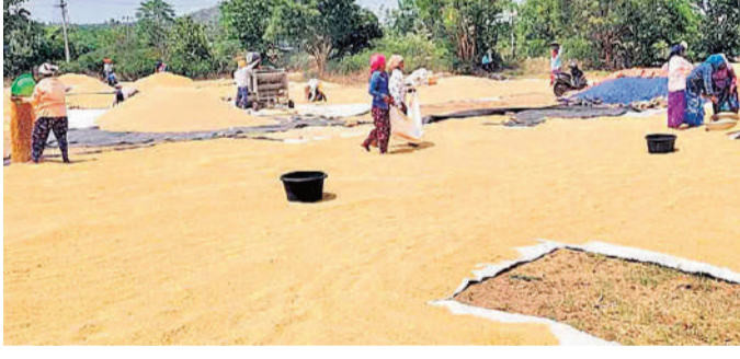
మిగతా 2వ పేజీలో..

కేసముద్రం మార్కెట్లో పెరిగిన కొనుగోళ్లు మహబూబాబాద్, జూన్ 18 (రాజముద్ర న్యూస్): వ్యవసాయ మార్కెట్లో ధాన్యం ధర ఈ సీజన్లో అత్యధికంగా క్రిస్టాకు రూ.2,906 నమోదైంది. గత 15 రోజులుగా ఈ మార్కెట్లో అరవనాటి రకం వద్దరేట్ రోజురోజుకూ పెరుగుతోంది. స్థానిక మార్కెట్కు ఈ వేలంలో