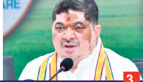
మిగతా 3వ పేజీలో..

11శాతం ఫిట్మెంట్ అమలుకు నిర్ణయం జూలై 1 నుంచే అమలు చేస్తామన్న మంత్రి పాన్డం హైదరాబాద్, జూన్ 18 (రాజముద్ర న్యూస్): తెలంగాణ ఆర్టీసీ ఉద్యోగులకు మంత్రి పాన్డం ప్రభాకర్ శుభవార్త చెప్పారు. ఆర్టీసీ సమ్మెలో ఇచ్చిన