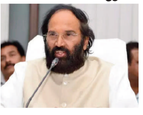
మిగతా 2వ పేజీలో..

30న రైతు భరోసా నిధులు విడుదల ముఖ్యమంత్రి సీఎం రేవంత్ చేతుల మీదుగా అందచేత ఏడు రకాల సన్నాలకు బోనస్ ఇవ్వాలని నిర్ణయం ధాన్యం కొనుగోళ్లలో కేంద్రం తీరుపై ఆగ్రహం కేబినెట్ భేటీలో పలు అంశాలపై చర్చ వివరాలు వెల్లడించిన మంత్రి ఉత్తమ్ కుమార్