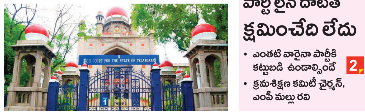
మిగతా 3వ పేజీలో..

అందులో 5 ఎకరాల తమవేంటూ ఎస్బిబి పిటిషన్ కౌంటర్ దాఖలు చేయాలని ప్రతివాదులకు నోటీసులు హైదరాబాద్, జూన్ 18: హైదరాబాద్ రాయదుర్గం భూముల వేలంపై తెలంగాణ హైకోర్టు విధించింది. మూడు వారాల పాటు విధిస్తూ మధ్యంతర