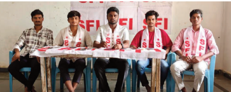
చేవెళ్ల, రాజముద్ర న్యూస్: