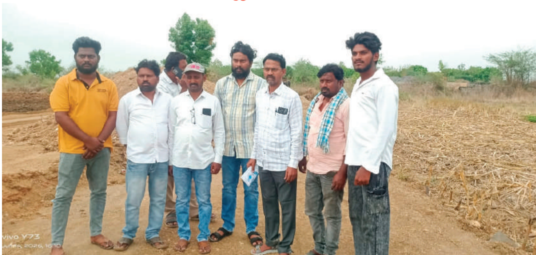
అభ్యంతరం చెబితే బెదిరింపులు: