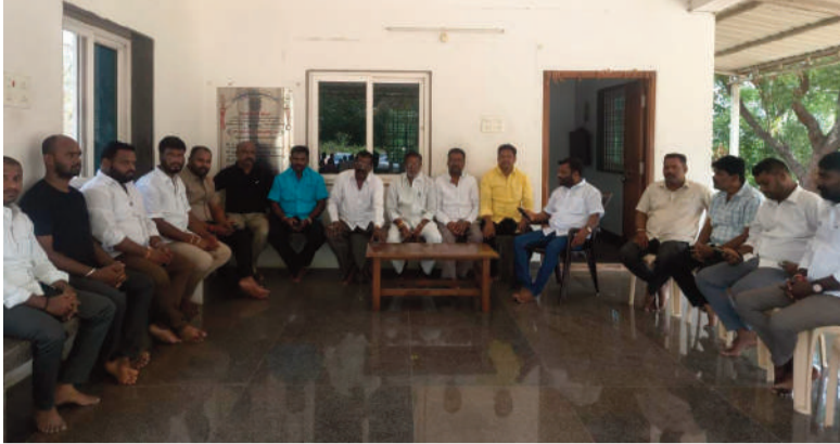
కీసర, రాజముద్ర న్యూస్: