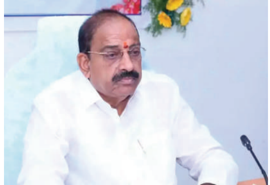
పేర్కొన్నారు. ఎరువుల బుకింగ్ యాప్ లో కొత్త సదుపాయాలు

రాష్ట్రంలోని రైతులు వరి పంటపై మాత్రమే ఆధారపడకుండా కందులు, పెసలు, మినుములు, జొన్నలు, సజ్జలు, మొక్కజొన్న, సువ్వులు, అముదం వంటి తక్కువ నీటితో సాగయ్యే పంటలను ప్రోత్సహించేలా ప్రత్యేక కార్యాచరణ ప్రణాళికను సిద్ధం చేసినట్లు వ్యవసాయ శాఖ మంత్రి తుమ్మల నాగేశ్వరరావు తెలిపారు. ఆదివారం ఖరీఫ్ సీజన్ సన్నద్ధతపై అధికారులతో సమీక్ష నిర్వహించిన మంత్రి, విత్తనాల కొరత తలెత్తకుండా 87.49 లక్షల క్వింటాళ్ళ విత్తనాలను అందుబాటులో ఉంచినట్లు వెల్లడించారు. కందులు, జొన్నలు, మొక్కజొన్న, సజ్జలు వంటి ప్రత్యామ్నాయ పంటల విత్తనాలను జిల్లాలో ముందుగానే నిల్వ చేసినట్లు చెప్పారు. ఎల్ఎన్ఐ ప్రభావాన్ని ముందుగానే అంచనా వేసి ఏప్రిల్ నెలలోనే వ్యవసాయ శాఖ అధికారులు, వ్యవసాయ విశ్వవిద్యాలయ శాస్త్రవేత్తలు, వాతావరణ శాఖ నిపుణులతో సమావేశాలు నిర్వహించి ముందస్తు ప్రణాళిక రూపొందించినట్లు తెలిపారు. వర్షాలు అలభ్యమైనా లేదా తక్కువగా కురిసినా రైతులకు ఇబ్బందులు లేకుండా ప్రత్యామ్నాయ సాగు ప్రణాళికలు సిద్ధం చేసినట్లు