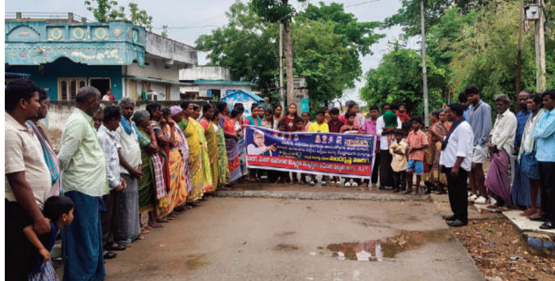
ఖమ్మం, రాజముద్ర న్యూస్