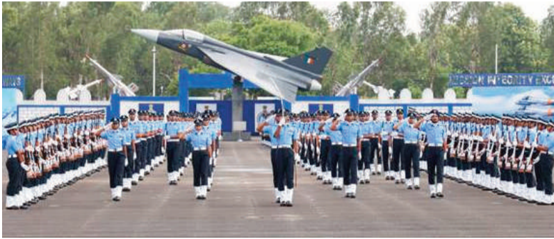
ఆధునిక యుద్ధాలకు సిద్ధంగా ఉండాలి

తెలియజేస్తూ దేశ రక్షణలో వారి పాత్ర ఎంతో కీలకమని పేర్కొన్నారు. ఈ సందర్భంగా శిక్షణ పూర్తి చేసుకున్న 245 మంది క్యాడెట్లకు రాజ్ నాథ్ సింగ్ శుభాకాంక్షలు తెలిపారు. వియత్నాంకు చెందిన విదేశీ క్యాడెట్లను కూడా ప్రత్యేకంగా అభినందించారు. భారత ఎయిర్ ఫోర్స్ అకాడమీ విదేశీ విద్యార్థులకు సైతం శిక్షణ అందించడం దేశానికి గర్వకారణమని ఆయన అన్నారు.