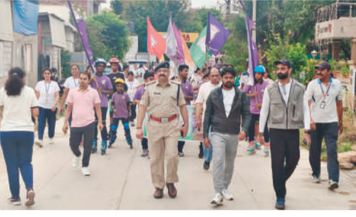
కాప్రా, రాజముద్ర న్యూస్:

శాంతి సందేశం తో ఆకట్టుకున్నా, ఐదు కిలో మీటర్ల శాంతి పరుగు