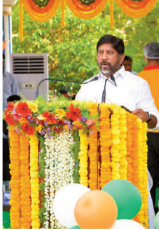
మగతా 2వ పేజీలో..

ఖమ్మం, జూన్ 2 (రాజముద్ర న్యూస్): తెలంగాణలో జర్నలిస్టుల సంక్షేమానికి ప్రభుత్వం ప్రత్యేక ప్రాధాన్యం ఇస్తోందని ఉప ముఖ్యమంత్రి మల్లు భట్టి విక్రమార్క తెలిపారు. జర్నలిస్టులకు ఇళ్ల స్థలాలు, ఇళ్ల కేటాయింపు అంశాన్ని ప్రభుత్వం సానుకూలంగా పరిశీలిస్తోందని చెప్పారు. ఈ సమస్యపరిష్కారం