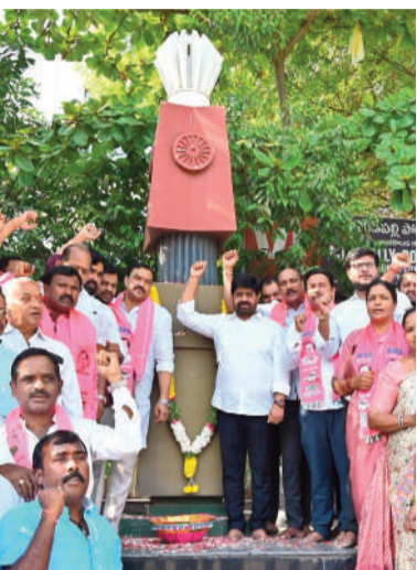
(కేసీఆర్) నాయకత్వాన్ని గుర్తు చేసుకుంటూ తెలంగాణ ఆవిర్భావం పోషించిన బీఆర్ఎస్ అధినేత తెలంగాణ తొలి ముఖ్యమంత్రి కే. చంద్రశేఖర్ రావు