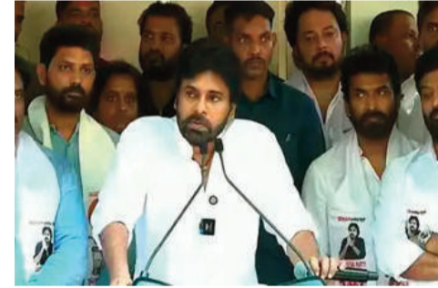
మగతా 2వ పేజీలో..

హైదరాబాద్, జూన్ 2 (రాజముద్ర న్యూస్): తెలంగాణలో ప్రజల సమస్యలపై స్పందించడం జనసేన పార్టీ బాధ్యత అని ఆ పార్టీ అధినేత, ఆంధ్రప్రదేశ్ ఉప ముఖ్యమంత్రి పవన్ కల్యాణ్ పేర్కొన్నారు. తెలంగాణ ఎవరి వ్యక్తిగత ఆస్తి కాదని, ప్రజా సమస్యలపై మాట్లాడే హక్కు ప్రతి రాజకీయ పార్టీకి