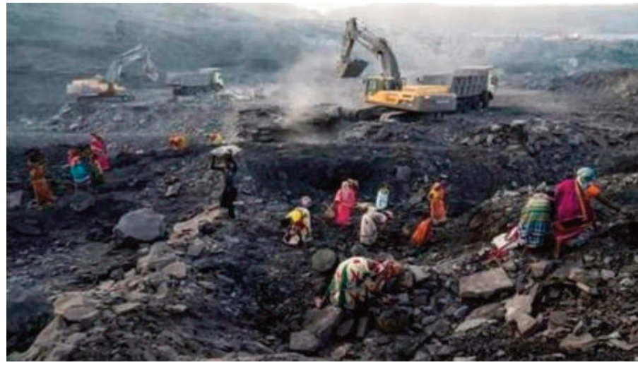
మిగతా 2వ పేజీలో..

కార్మిక సంక్షేమానికి పెద్దపీట వేయాలన్న రాష్ట్ర ప్రభుత్వం సూచనల మేరకు సింగరేణి యాజమాన్యం దేశంలోనే తొలిసారిగా రూ.1.25 కోట్ల ఉచిత ప్రమాద బీమా పథకాన్ని అమలు చేస్తూ ఆదర్శంగా నిలిచింది. 2024లో ముఖ్యమంత్రి రేవంత్ రెడ్డి, ఉప ముఖ్యమంత్రి భట్టి విక్రమార్క చేతుల మీదుగా ప్రారంభమైన ఈ పథకం ప్రస్తుతం దేశవ్యాప్తంగా చర్చనీయాంశంగా మారింది. సింగరేణి ఉద్యోగులు జీతాలు పొందుతున్న పలు బ్యాంకులు ఈ పథకంలో భాగస్వామ్యమై ప్రమాద బీమా సదుపాయాన్ని అందిస్తున్నాయి. పంజాబ్ నేషనల్ బ్యాంక్, బ్యాంక్ ఆఫ్