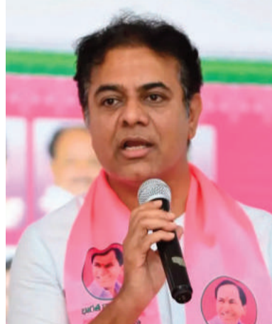
మిగతా 3వ పేజీలో..

రైతు డిస్కం పేరుతో కాంగ్రెస్ ప్రభుత్వం మరో మోసానికి తెరలేపిందని బీఆర్ఎస్ వర్కింగ్ ప్రెసిడెంట్ కేటీఆర్ ఆరోపించారు. వ్యవసాయానికి రోజుకు మూడు గంటల విద్యుత్ చాలని