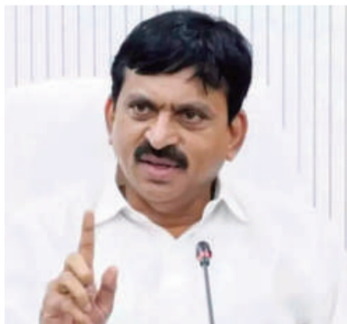
మిగతా 3వ పేజీలో..

స్వతంత్ర భారతదేశ చరిత్రలో ఎన్నడూ లేని విధంగా పేదల సొంతింటి కలలను సాకారం చేసేందుకు తెలంగాణ ప్రభుత్వం చేపట్టిన ఇందిరమ్మ ఇళ్ల పథకం దేశానికే మార్గదర్శకంగా నిలుస్తోందని గృహ నిర్మాణ, రెవెన్యూ,