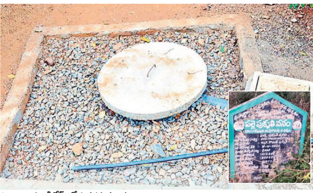
నిర్మాణాల నుండి నేమ్ బోర్డు వరకు మాయాజాలం

నేలకొండపల్లి మండలంలో పని చేసిన ఎంతోమంది ఎంపీడీఓలు వివిధ ప్రాంతాలకు బదిలీ అయిన సరే ఏపీఓ మాత్రం స్థానచలనం లేదు. గత పన్నెండేళ్లుగా ఇదే మండలంలో తిప్ప వేసిన ఏపీఓ తెలివిగా వ్యవహరించి వచ్చిన అవకాశాలను ఆర్థిక వనరులుగా మార్చుకుంది. మండలం పై పూర్తి స్థాయిలో పట్టు సాధించడంతో 2019 సంవత్సరంలో గెలుపొందిన సర్పంచులు, అదే సమయంలో విధుల్లో చేరిన జూనియర్ పంచాయితీ కార్యదర్శిలు అంతా కొత్తవారే కావడంతో ఇక ఆమె బినామీ కార్యకలాపాలకు అడ్డు అదుపు లేకుండా పోయింది. నిర్మాణాల నుండి నేమ్ బోర్డు వరకు బినామీ పేర్లతో చేసిన మాయాజాలం అంతా ఇంతా కాదు. మెటీరి