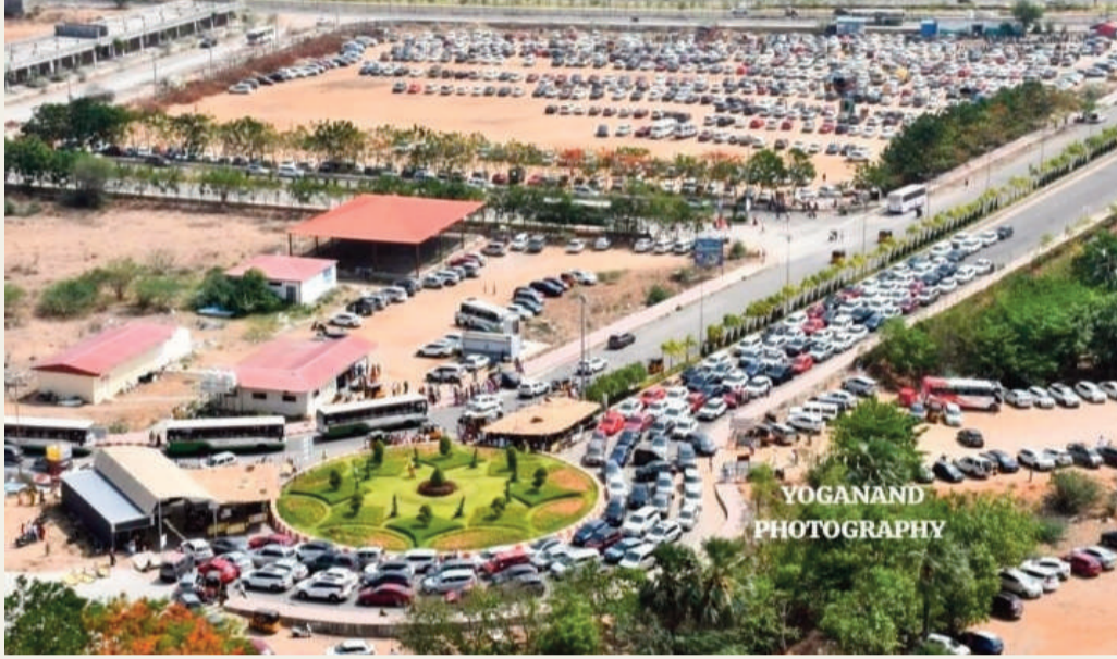
రద్దీ కనిపించింది. వాహనాలతో కొండపైకి చేరుకోవడానికి సుమారు ఒక గంట సమయం పడుతోందని వాహనదారులు తెలిపారు. దీంతో కొండపైకి వెళ్లే మార్గంలో ట్రాఫిక్ నియంత్రణకు పోలీసులు చర్యలు తీసుకున్నారు.

యాదగిరిగుట్ట పుణ్యక్షేత్రం శ్రీ లక్ష్మీనరసింహస్వామి దేవాలయం ఆదివారం భక్తులతో అత్యంత రద్దీగా మారింది. రాష్ట్రం నలుమూలల నుంచే కాకుండా ఆంధ్ర ప్రదేశ్ వివిధ ప్రాంతాల నుంచి కూడా పెద్ద సంఖ్యలో భక్తులు స్వామివారి దర్శనానికి తరలివచ్చారు. దీంతో ఆలయ ప్రాంగణం మొత్తం భక్తులతో నిండిపోయి ఆధ్యాత్మిక వాతావరణం మరింత ఉత్సాహంగా కనిపించింది. స్వామివారి ప్రత్యేక దర్శనం కోసం వచ్చిన భక్తులు సుమారు గంట నుంచి రెండు గంటల వరకు క్యూలైన్లలో వేచి ఉండాల్సి పరిస్థితి ఏర్పడింది. అదే సమయంలో సాధారణ దర్శనానికి మూడు నుంచి నాలుగు గంటల వరకు సమయం పట్టినట్లు ఆలయ అధికారులు తెలిపారు. క్యూలైన్లు ఆలయ ప్రాంగణం బయట వరకు విస్తరించడంతో భక్తుల రద్దీని నియంత్రించేందుకు ఆలయ సిబ్బంది ప్రత్యేక చర్యలు చేపట్టారు. ఇక కొండపైకి చేరే మార్గంలో కూడా భారీగా వాహన