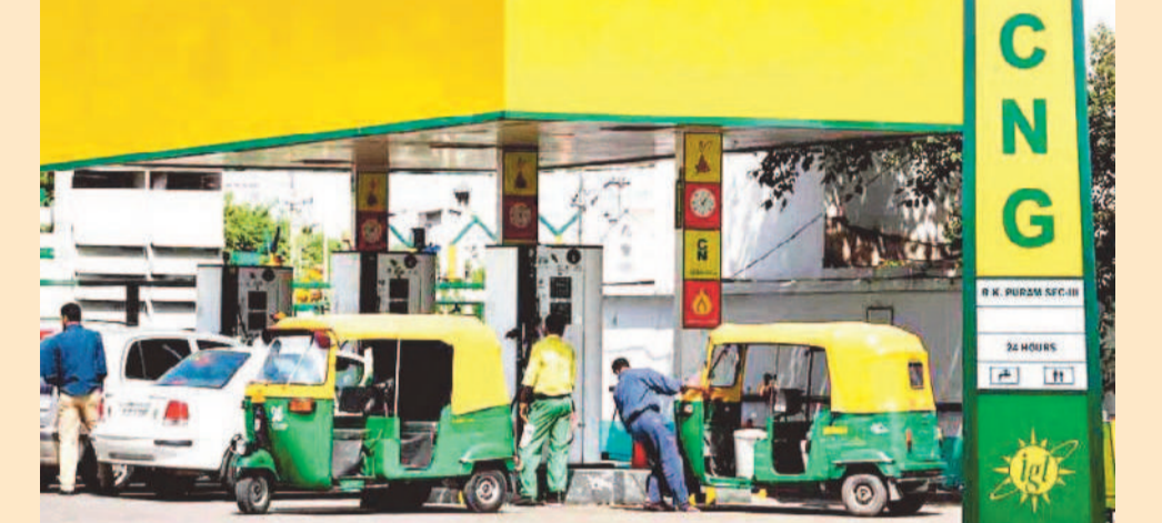
ఎన్నికలు ముగిసాక వరుసగా ధరలు పెంచుకుంటూ పోతున్నది. తాజాగా మరోసారి ఇంధన ధరలను పెంచారు. సిఎన్జి ధరలు పెరగడంతో వాహనదారులు, ఆటో, క్యాబ్, ట్రాన్స్పోర్ట్ రంగాలపై అదనపు భారం పడనుంది. ఎన్నికల ముందు ఇంధన ధరలు పెంచబోమని పదేపదే ప్రకటించిన కేంద్రం..

న్యూఢిల్లీ, మే 26: కేంద్రం మళ్లీ షాకిచ్చింది. సిఎన్జి ధరలను మరోసారి పెంచింది. కిలో సిఎన్జిపై రూ. 2 పెంచింది. పెరిగిన ధరలు మంగళవారం నుంచే అమలులోకి వచ్చాయి. తాజా పెంపుతో ఢిల్లీలో సిఎన్జి ధర రూ. 81.09 నుంచి రూ. 83.09కి చేరింది. సిఎన్జి ధరలను పెంచడం మే 15వ తేదీ నుంచి ఇది నాలుగోసారి కావడం గమనార్హం. మే 15వ తేదీన మొదట కిలోకు రూ. 2 పెంచగా.. అనంతరం రెండుసార్లు ఒక్క రూపాయి చొప్పున కేంద్రం పెంచింది. తాజాగా మరో రూ. 2 పెరగడంతో నాలుగోసారి సిఎన్జి ధరలు పెరిగినట్లు అవుతుంది. గత 11 రోజుల్లో మొత్తం రూ. 7 వరకు ధరలు పెరగడంతో వాహనదారులు, ఆటో, క్యాబ్, ట్రాన్స్పోర్ట్ రంగాలపై అదనపు భారం పడనుంది. ఎన్నికల ముందు ఇంధన ధరలు పెంచబోమని పదేపదే ప్రకటించిన కేంద్రం..