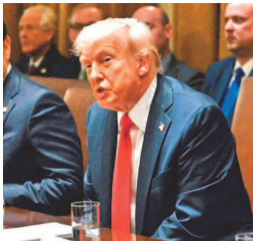
కాపాడేందుకు అవసరమైతే మరింత కఠిన నిర్ణయాలు తీసుకుంటామని కూడా చెప్పారు. కాగా, తమ వద్ద ఉన్న శుద్ధి చేసిన యురేనియంను వదులుకోవడానికి ఇరాన్ అంగీకరించినట్లు వార్తలు వస్తున్నాయి. తాము

వాషింగ్టన్, మే 26: అమెరికా-ఇరాన్ మధ్య జరుగుతున్న శాంతి చర్చల్లో అణు కార్యక్రమం కీలకంగా మారింది. శుద్ధ చేసిన యురేనియంను వదులుకోవాలని అమెరికా కోరుతుండగా, అందుకు ఇరాన్ పూర్తిగా అంగీకరించడం లేదు. తాజాగా ఇరాన్ అణు కార్యక్రమంపై అమెరికా అధ్యక్షుడు డొనాల్డ్ ట్రంప్ కీలక వ్యాఖ్యలు చేశారు. ఇరాన్ వద్ద ఉన్న అధికంగా శుద్ధి చేసిన యురేనియంను అమెరికాకు అప్పగించాలని, లేదంటే అంతర్జాతీయ పర్యవేక్షణలో పూర్తిగా ధ్వంసం చేయాలని ట్రంప్ స్పష్టం చేశారు. ఇరాన్ అణు కార్యక్రమం ప్రపంచ దేశాలకు ముప్పుగా మారే అవకాశముందని ట్రంప్ హెచ్చరించారు. అధిక శుద్ధి చేసిన యురేనియం ద్వారా అణ్వాయుధాల తయారీ సాధ్యమవుతుందని, అందుకే దీనిపై కఠిన చర్యలు అవసరమని పేర్కొన్నారు. అమెరికా జాతీయ భద్రతను