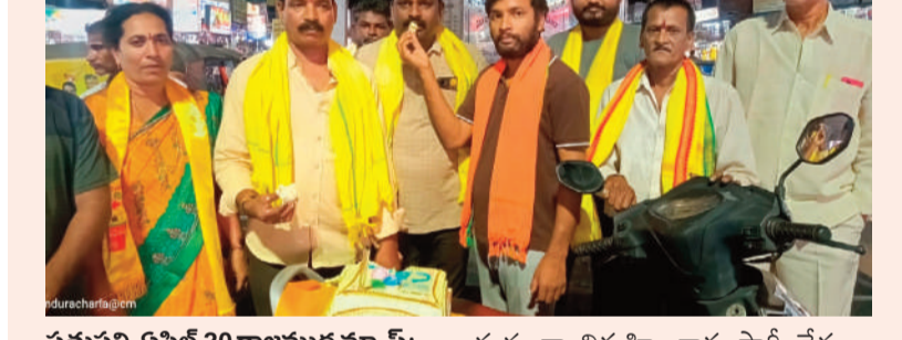
సత్తుపల్లి, ఏప్రిల్ 20 రాజముద్ర న్యూస్: