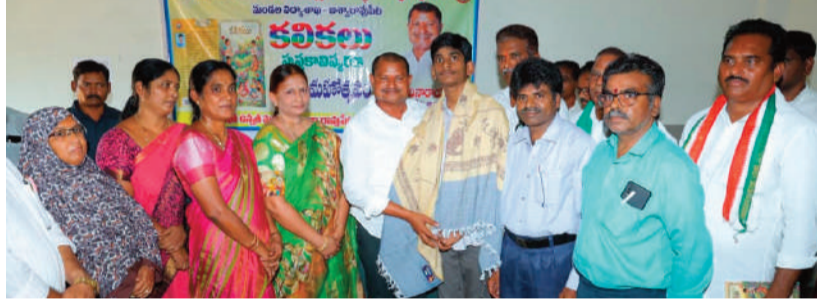
అస్వారావుపేట, ఏప్రిల్ 20 రాజముద్ర న్యూస్: