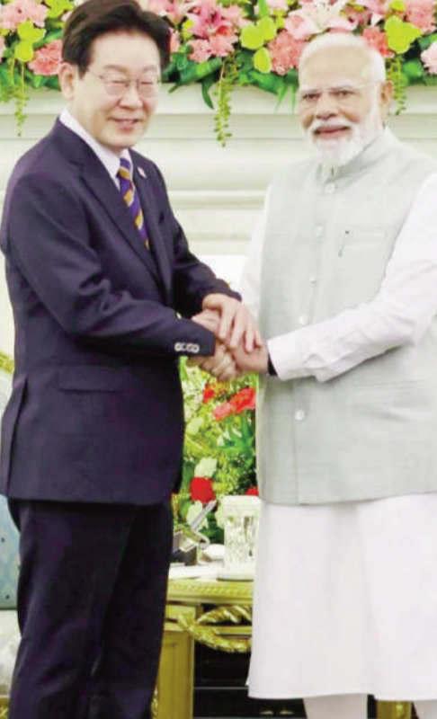
అలాగే ఇండో-పసిఫిక్ ప్రాంతంలో శాంతి, స్థిరత్వం కోసం రెండు దేశాలు కలిసి పనిచేస్తాయని మోదీ తెలిపారు.

న్యూఢిల్లీ, ఏప్రిల్ 20: భారత్, దక్షిణ కొరియా మధ్య ద్వైపాక్షిక సంబంధాలు మరింత బలపడుతున్నాయని ప్రధాని నరేంద్ర మోదీ అన్నారు. దక్షిణ కొరియా అధ్యక్షుడు లీ జే మ్యూంగ్ మూడు రోజుల పర్యటన కోసం భారత్ వచ్చారు. ఇరు దేశాల మధ్య సోమవారం పలు ఒప్పందాలు కుదిరాయి. అనంతరం నిర్వహించిన సంయుక్త మీడియా సమావేశంలో ప్రధాని మోదీ మాట్లాడారు. ఇరు దేశాల మధ్య ద్వైపాక్షిక సంబంధాల్లో ఇది కీలక ముందడుగు అని అన్నారు. భారత్, దక్షిణ కొరియా మధ్య సంబంధాలు కేవలం వాణిజ్యానికి మాత్రమే పరిమితం కాకుండా టెక్నాలజీ, రక్షణ, పిప్ బిల్డింగ్, ఎనర్జీ వంటి విభిన్న రంగాల్లో విస్తరిస్తున్నాయని ప్రధాని పేర్కొన్నారు. చిప్స్ నుంచి పిప్స్ వరకు, ట్యాంకర్ల నుంచి టెక్నాలజీ వరకు, ఎంటర్టైన్ మెంట్ నుంచి ఎనర్జీ వరకు.. ఇలా వివిధ రంగాల్లోని అవకాశాలను అందిపుచ్చుకునే విధంగా దక్షిణ కొరియాతో భాగస్వామ్యం చేసుకుంటున్నట్లు తెలిపారు. ప్రస్తుతం ఇరు దేశాల మధ్య సుమారు 27 బిలియన్ డాలర్లుగా ఉన్న వాణిజ్యాన్ని 2030 నాటికి 50 బిలియన్ డాలర్లకు పెంచేందుకు చర్యలు తీసుకుంటున్నట్లు ప్రధాని తెలిపారు. ఈ సమావేశంలో పలు కీలక ఒప్పందాలు కూడా కుదిరాయి. ముఖ్యంగా పారిశ్రామిక రంగం, టెక్నాలజీ, ఎనర్జీ, ట్రికిల్ డౌన్ మినరల్స్ వంటి రంగాల్లో వరసరసం సహకరించుకునేందుకు ఇరు దేశాలు అంగీకరించాయి.