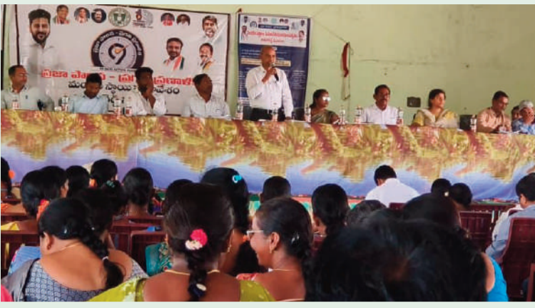
సంక్షేమ పథకాలపై అవగాహన సదస్సు