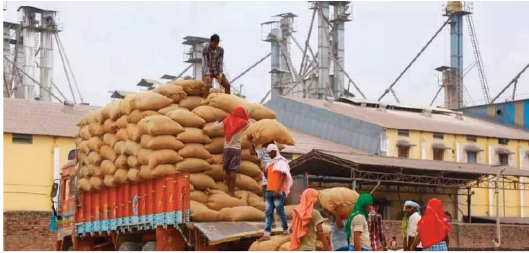
కొనసాగుతున్నాయి. ఆ శాఖకు చెందిన అధికారులు అగ్ని ప్రమాదాలు జరగకుండా చూడాలి ఉంది. కానీ బీరూర్; నసుల్లాబాద్ మండలంలోని పలు రైస్ మిల్లులో ఫైర్ సేఫ్టీ లేకున్నా అగ్ని మాపక శాఖ అధికారులు చూసేచూడనట్లు ఉండటంపై సర్వత్రా విమర్శలు వెలువెతుతున్నాయి.

ఫైర్ సేఫ్టీ ఎక్కడ...? బీరూర్ ఉమ్మడి మండలంలో ఉన్న పలు మిల్లులో ఫైర్ సేఫ్టీ లేదు. ప్రస్తుతం అగ్ని మాపక వారోత్సవాలు జోరుగా