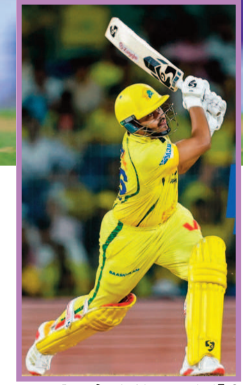
చెన్నై, ఏప్రిల్ 14: సొంత గడ్డపై చెన్నై సూపర్ కింగ్స్ సత్తా చాటింది. ఇండియన్ ప్రీమియర్ లీగ్ సీజన్ లో భాగంగా చెన్నైలోని ఎంఎ చిదంబరం (ఐపాక్) స్టేడియంలో మంగళవారం జరిగిన 22వ మ్యాచ్ లో కోల్కతా నైట్ రైడర్స్ జట్టును చిత్తుగా ఓడించింది. బ్యాటింగ్, బౌలింగ్ విభాగాల్లో సమష్టిగా రాణించిన చెన్నై. కోల్కతాపై 32 పరుగుల తేడాతో ఘన విజయం సాధించింది. టాస్ గెలిచిన కోల్కతా ముందుగా బౌలింగ్ ఎంచుకోగా, తొలుత బ్యాటింగ్ చేసిన చెన్నై నిర్ణీత 20 ఓవర్లలో 5 వికెట్ల సహనానికి 192 పరుగులు భారీ స్కోరు సాధించింది. లక్ష్య ఛేదనలో తడబడిన కోల్కతా 20 ఓవర్లలో 7 వికెట్ల కోల్పోయి 160 పరుగులతో పరిమితమై పరాజయాన్ని మూటగట్టుకుంది.

కోల్కతా నైట్ రైడర్స్ చిత్తు • 32 పరుగుల తేడాతో సూపర్ కింగ్స్ ఘన విజయం • చెలరేగిన శాంసన్, బ్రెవిస్, ఆయుష్ • స్పిన్ మాయాజాలంతో దెబ్బకొట్టిన నూర్ అమ్మాద్