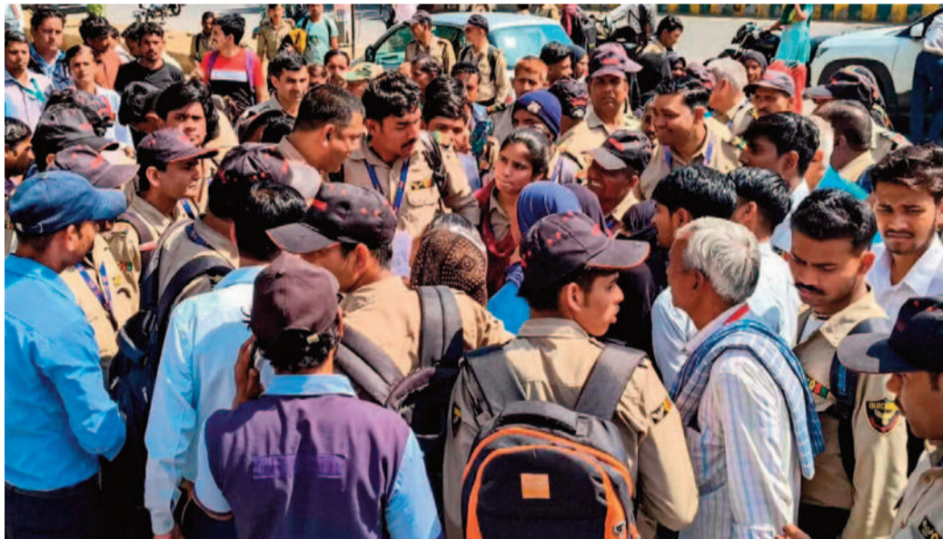
కార్మికులకు భారీ ఊరటనిస్తూ కీలక నిర్ణయం తీసుకుంది. కార్మికుల కనీస వేతనాలను మూడు వేల రూపాయల వరకు పెంచుతున్నట్లు మంగళవారం ప్రకటించింది. దీని ప్రకారం నోయిదా, ఘజియాబాద్ ప్రాంతాల్లోని నైపుణ్యం లేని కార్మికుల నెలవారీ వేతనం 11,313 రూపాయల నుండి 13,690 రూపాయలకు పెరిగింది. పెంచిన ఈ వేతనాలు ఏప్రిల్ 1 నుంచే అమల్లోకి వస్తాయని ప్రభుత్వం స్పష్టం చేసింది. అయితే మంగళవారం

లక్నో, ఏప్రిల్ 14: నోయిదా పారిశ్రామిక ప్రాంతంలో వేతనాల పెంపు కోరుతూ కార్మికులు చేపట్టిన నిరసనలు ఒక్కసారిగా హింసాత్మక రూపం దాల్చడం వెనుక దేశ వ్యతిరేక శక్తుల ప్రయోగం ఉందన్న అనుమానాలు బలపడుతున్నాయి. ఈ అల్లర్ల వెనుక పాకిస్థాన్ ఉగ్రవాద సంస్థల హస్తం ఉందన్న ఉత్తర ప్రదేశ్ కార్మిక శాఖ మంత్రి అనిల్ రాజ్ భర్త సంవలన వ్యాఖ్యలు చేశారు. పక్కా ప్రణాళిక ప్రకారమే ఈ విధ్వంసం జరిగిందని, రాష్ట్రంలో అస్థిరత సృష్టించేందుకు విదేశీ శక్తులు ప్రయత్నిస్తున్నాయని ఆయన ఆరోపించారు. ఇటీవల నోయిదా, మీరట్ లో పాక్ ఉగ్రవాదులతో సంబంధాలున్న నలుగురు అనుమానితులు అరెస్టుయిన నేపథ్యంలో, తాజా అల్లర్లను కూడా అదే కోణంలో దర్శిస్తూ చేయాలని అధికారులను ఆదేశించి నల్లు మంత్రి వెల్లడించారు. ముఖ్యంగా ముజఫ్ఫర్ నగర్ లో ముఖ్యమంత్రి యోగి ఆదిత్యనాథ్ పర్యటనకు అంతరాయం కలిగించే కుట్రలో భాగంగానే ఈ అలజడి సృష్టించి ఉండొచ్చని ప్రాథమిక విచారణలో తేలిందని ఆయన పేర్కొన్నారు. సీఐటీ దృశ్యాల ఆధారంగా విధ్వంసానికి పాల్పడిన 300 మందిని పోలీసులు ఇప్పటికే అరెస్టు చేయగా, మరో వంద మందిని విచారిస్తున్నారు. మరోవైపు ఉద్రిక్తతలను చల్లార్చేందుకు ఉత్తర ప్రదేశ్ ప్రభుత్వం