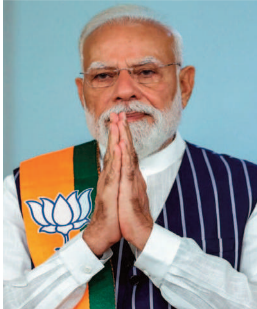
మహిళలకు అన్యాయం చేసినట్లే. 2029 లోక్ సభ

న్యూఢిల్లీ, ఏప్రిల్ 14: రానున్న సార్వత్రిక ఎన్నికల నాటికి మహిళల రిజర్వేషన్లు అమలవుతాయని, దీంతో మన రాజ్యాంగం మరింత బలోపేతం అవుతుందని ప్రధాని నరేంద్ర మోడీ వెల్లడించారు. ఈ మేరకు ఆయన దేశ మహిళలకు ఓ లేఖ రాసి దాన్ని 'ఎక్స్' వేదికగా పంపాడు. ప్రస్తుతం పలు రంగాల్లో మహిళలు ముందంజలో ఉన్నారు. అదేవిధంగా చట్ట సభల్లోనూ వారి ఉనికిని చాటేందుకు ఈ రిజర్వేషన్ల పద్ధతి మొదలుపెట్టాలి. పార్లమెంట్లో ఏప్రిల్ 16 నుంచి జరగనున్న మూడు రోజుల సమావేశాల్లో 'నారి శక్తి' వందనం అధినియమ్ బిల్లులో సవరణలు ప్రవేశపెడతాం. దీనిపై ఏమాత్రం ఆలస్యం జరిగినా అది భారతదేశ