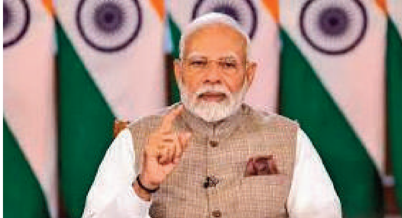
న్యూఢిల్లీ, ఏప్రిల్ 12: మహిళా రిజర్వేషన్ చట్టం (నారీ శక్తి వందన్ అధినయమ్) అమలుకు మద్దతు ఇవ్వాలని కోరుతూ ప్రధాని నరేంద్రమోదీ ఆన్లైన్ పార్టీల ప్లాట్ ఫోర్మ్ లీడర్లకు లేఖ రాశారు. వ్యక్తులు, పార్టీలకు అతీతంగా మహిళలకు రాజకీయాల్లో సమచిత అవకాశాలు కల్పించే సమయం ఆసన్నమైందని ఆయన పేర్కొన్నారు. మగతా 2వ పేజీలో..

మహిళా రిజర్వేషన్ అమలుకు సమయం ఆసన్నమైందని వ్యాఖ్య 2029 ఎన్నికలను 33% రిజర్వేషన్తో నిర్వహించాలని సూచన పార్టీలకు అతీతంగా చట్టానికి మద్దతు ఇవ్వాలని పిలుపు ఎంపీలకు ప్రధాని మోదీ లేఖ ఏప్రిల్ 16 నుంచి పార్లమెంటులో బిల్లుపై చర్చ ప్రారంభం