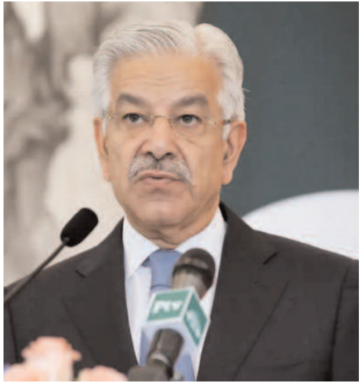
దాడులకు పాల్పడే అవకాశం ఉందని ఇంటెలిజెన్స్ సమాచారం అందింది. ఎన్నికల వాతావరణాన్ని చెడగొట్టే పాక్ ప్రధాన ఉద్దేశమని అధికారులు అనుమానిస్తున్నారు.

న్యూఢిల్లీ/కోల్ కత్తా, ఏప్రిల్ 6: భారత్లో ఏదైనా 'పాల్స్ ఫైర్' అపరేషన్ జరిగితే, దానికి ప్రతికారంగా కోల్ కత్తాను టార్గెట్ చేస్తామంటూ పాకిస్తాన్ రక్షణ మంత్రి ఖవాజా అసిఫ్ చేసిన వివాదాస్పద వ్యాఖ్యలు అంతర్జాతీయంగా కలకలం రేపుతున్నాయి. ఈ నేపథ్యంలో భారత భద్రతా ఏజెన్సీలు అత్యంత అప్రమత్తమయ్యాయి. పాక్ మంత్రి వ్యాఖ్యల వెనుక ఉన్న లోతైన కుట్రలను అధికారులు విశ్లేషిస్తున్నారు. పశ్చిమ బెంగాల్లో ప్రస్తుతం జరుగుతున్న ఎన్నికల ప్రక్రియను దృష్టిలో ఉంచుకునే పాక్ మంత్రి కోల్ కత్తాను ప్రస్తావించారని నిఘా పర్సనల్ ఖాతాలో ఉన్నాయి. హుజూర్-ఉల్-జిహాద్ ఇస్లామీ (హుజీ), జమాత్-ఉల్-ముజాహిదీన్ బంగ్లాదేశ్ (జేఎంబీ) వంటి ఉగ్రవాద సంస్థలను రెప్పగొట్టి, బెంగాల్ మరియు అసోం రాష్ట్రాల్లో