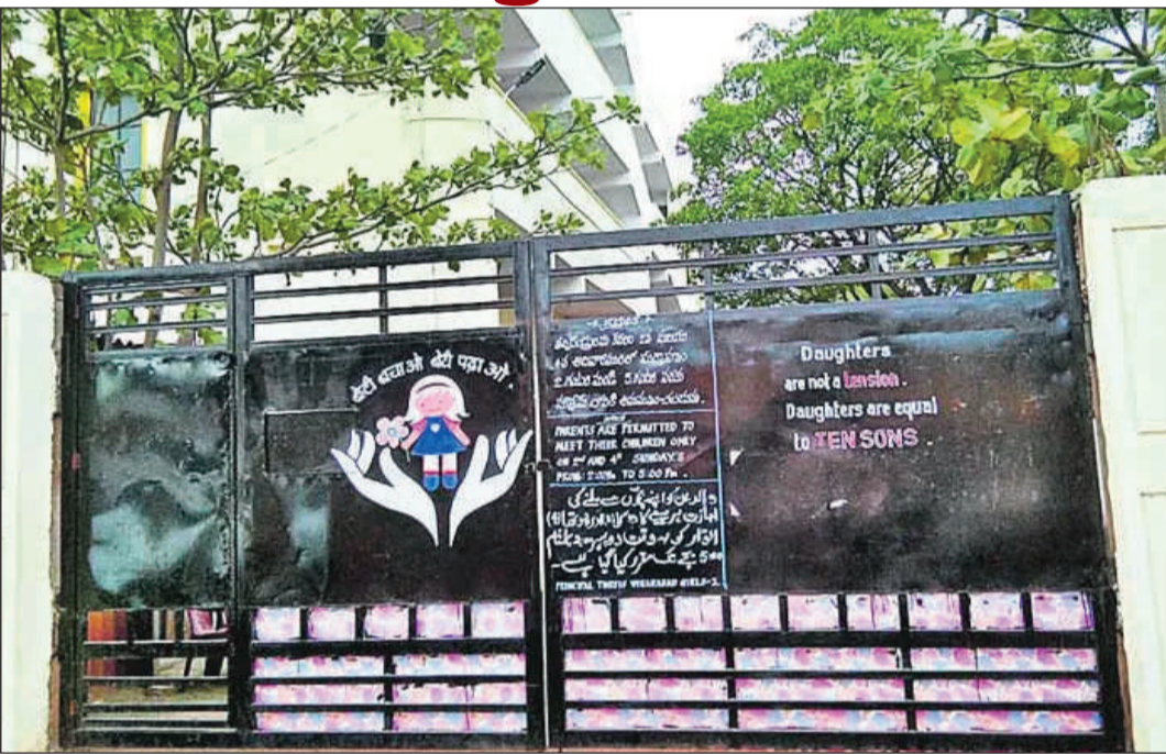
బోధనేతర విధులు నిర్వహిస్తున్నారు. వీరిందరి సేవలకు ఈనెల 23తో బ్రేక్ వడనుంది.

హైదరాబాద్, ఏప్రిల్ 5 : తెలంగాణలోని మైనార్టీ గురుకుల విద్యా సంస్థల సాసైటీ పరిధిలో పనిచేస్తున్న ఔట్ సోర్సింగ్ ఉద్యోగులకు ప్రభుత్వం పాకే ఇచ్చింది. విద్యా సంవత్సరం ముగియడంతో వారి సేవలను నిలిపివేస్తున్నట్లు సాసైటీ స్పష్టం చేస్తూ డెడ్ లైన్ విధించింది. ఈ మేరకు గురుకుల పాఠశాలల్లో పనిచేసే ఔట్ సోర్సింగ్ సిబ్బందికి ఈ నెల 23వ తేదీన చివరి పనిదినంగా ప్రకటిస్తూ, ఆ మరుసటి రోజు నుంచి విధులకు రావద్దని ట్రైనింగ్ కు ఆదేశాలు జారీ అయ్యాయి. మైనార్టీ జూనియర్ కాలేజీల్లో పనిచేసే సిబ్బందిని ఇప్పటికే మార్చి 31 నుంచే విధుల నుంచి తొలగించారు. ఇప్పుడు పాఠశాలల వంతు వచ్చింది. తాజా ఆదేశాలతో దాదాపు 2,250 మంది ఉద్యోగులు ఉపాధి కోల్పోనున్నారు. వీరికి కేవలం ఈనెల 23వ తేదీ వరకు మాత్రమే వేతనాలు చెల్లిస్తారు. ఆ తర్వాత వారి సర్వీసు కొనసాగించుపై ఎటువంటి స్పష్టత లేకపోవడంతో ఉద్యోగుల్లో ఆందోళన నెలకొంది.