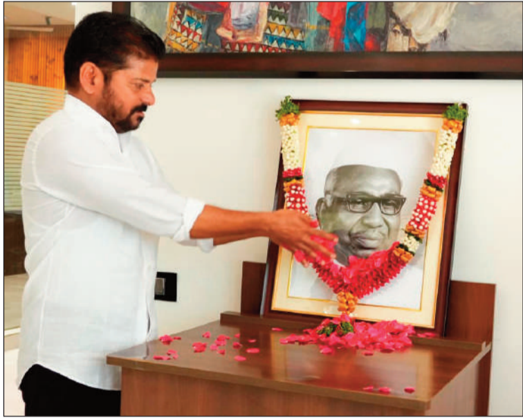
సామాజిక సమానత్వానికి బాబూజీ స్మారక సీంం రేవంత్ రెడ్డి నివాళి

హైదరాబాద్, ఏప్రిల్ 5(మనసలో మాట): భారత మాజీ ఉప ప్రధానమంత్రి, గొప్ప స్వాతంత్ర్య సమరయోధుడు డాక్టర్ బాబూ జగ్జీవన్ రామ్ 119వ జయంతి సందర్భంగా తెలంగాణ ముఖ్యమంత్రి ఎ. రేవంత్ రెడ్డి ఘన నివాళులు అర్పించారు. ఆదివారం జూబ్లీహిల్స్ లోని తన నివాసంలో జగ్జీవన్ రామ్ చిత్రపటానికి పూలమాల వేసి అంజలి ఘటించారు. ఈ సందర్భంగా ఆ మహనీయుడు దేశానికి చేసిన సేవలను సీఎం స్మరించుకున్నారు. అణగారిన వర్గాలు, కార్మికుల సంక్షేమం కోసం జగ్జీవన్ రామ్ చేసిన కృషి మరువలేనిది రేవంత్ రెడ్డి కొనియాడారు. “సమాజంలో వేళ్ళూనుకున్న కుల వివక్ష, అంటరానితనానికి వ్యతిరేకంగా బాబూజీ మొక్కవోని దీక్షతో పోరాడారు. దళితుల హక్కుల కోసం, వారి సామాజిక సాధికారత కోసం ఆయన జీవితంలో అంతీభావంతో పనిచేశారు” అని ముఖ్యమంత్రి పేర్కొన్నారు. బాబూ జగ్జీవన్ రామ్ ఆశయాలను తెలంగాణ ప్రభుత్వం తు.చ. తప్పకుండా పాటిస్తుందని సీఎం స్పష్టం చేశారు. “ఆయన అందించిన స్ఫూర్తితోనే తెలంగాణలో సామాజిక న్యాయం దిశగా మా ప్రభుత్వం అడుగులు వేస్తోంది. అన్ని వర్గాల మేలు కోసం, ముఖ్యంగా వెనుకబడిన తరగతుల అభ్యున్నతికి మా ప్రభుత్వం నిరంతరం కృషి చేస్తోంది” అని ఆయన పునరుద్ఘాటించారు. ఈ కార్యక్రమంలో పలువురు ప్రజా ప్రతినిధులు, ప్రభుత్వ ఉన్నతాధికారులు పాల్గొని బాబూజీ సేవలను స్మరించుకున్నారు. రాష్ట్రవ్యాప్తంగా ప్రభుత్వ కార్యాలయాల్లో జగ్జీవన్ రామ్ జయంతి వేడుకలను అధికారికంగా నిర్వహించారు.