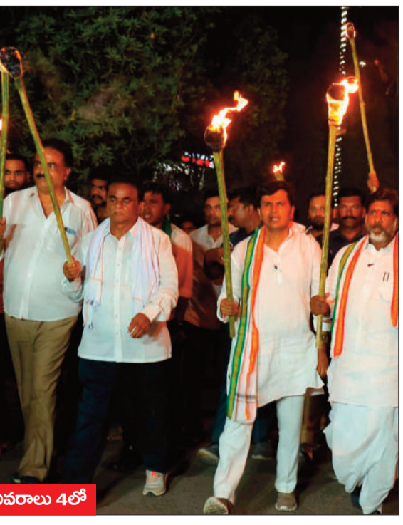
.. వివరాలు 4లో