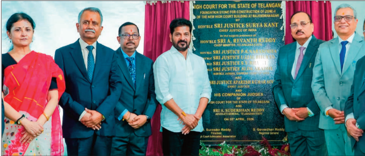
హైకోర్టు నూతన భవన సముదాయాల నిర్మాణాలను