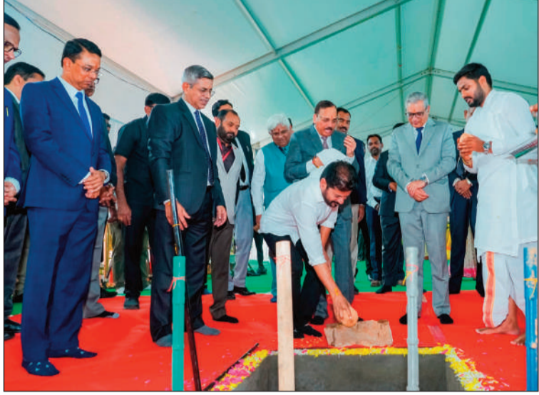
మొదటి పీజీ తరువాతి