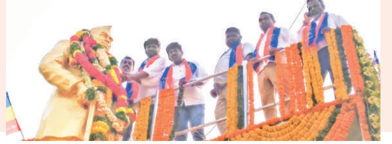
తీసివాన్ నాయకులు పాల్గొన్నారు.