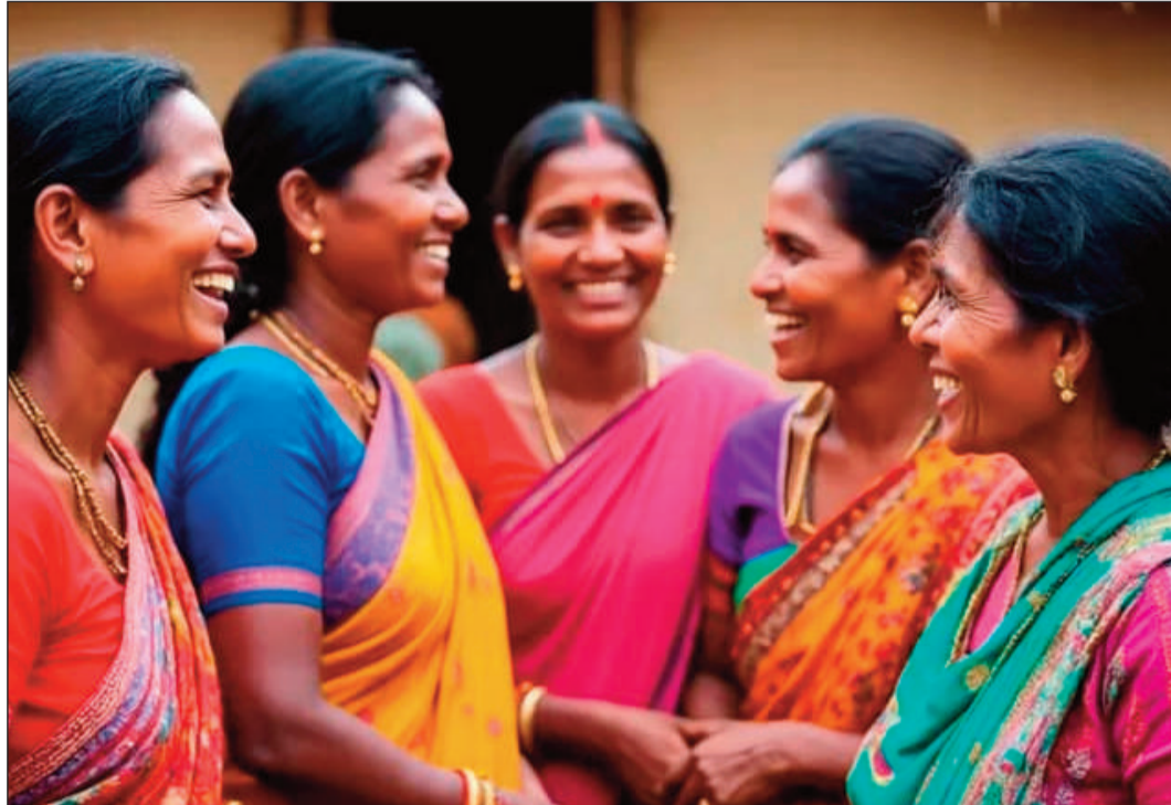
అర్జునై న వారికి ఎలాంటి ఇబ్బందులు లేకుండా పింఛన్లు అందజేస్తామని ప్రభుత్వం హామీ ఇచ్చింది. ఈ నిర్ణయంతో రాష్ట్రంలో వృద్ధ మహిళల జీవన ప్రమాణాలు మెరుగుపడటంతో పాటు, వారికి ఆర్థిక భద్రత మరియు సామాజిక గౌరవం పెరుగుతుందని అధికారులు పేర్కొంటున్నారు...

హైదరాబాద్, ఏప్రిల్ 5 : తెలంగాణ రాష్ట్రంలో మహిళల సాధికారత దిశగా మరో ముఖ్యమైన అడుగు పడబోతోంది. రాష్ట్రంలో 60 ఏళ్లు పైబడిన మహిళల కోసం ప్రత్యేకంగా పాదుపు సంఘాలను ఏర్పాటు చేయనున్నట్లు ఇటీవల మంత్రి సీతక్క తెలిపారు. ఇప్పటికే 60 ఏళ్ల లోపు మహిళల స్వయం సహాయక సంఘాల ద్వారా ఆర్థికంగా ముందుకు సాగుతున్న నేపథ్యంలో, ఇప్పుడు వృద్ధ మహిళలకు కూడా అదే విధంగా ఆర్థిక భద్రత కల్పించేందుకు ప్రభుత్వం ఈ నిర్ణయం తీసుకుంది. ఈ ప్రత్యేక పాదుపు సంఘాల ద్వారా వృద్ధ మహిళలు చిన్న మొత్తాల్లో పాదుపు చేసి, అవసరమైనప్పుడు తక్కువ వడ్డీతో రుణాలు పొందే అవకాశాన్ని కల్పించనున్నారు. దీంతో గ్రామీణ ప్రాంతాల్లో ఉన్న మహిళల స్వయం ఉపాధి అవకాశాలు పొందడంతో పాటు, ఆర్థికంగా మరింత బలపడే అవకాశం ఉంది. అలాగే 2026-27 ఆర్థిక సంవత్సరంలో కొత్తగా రెండు లక్షల మందికి పింఛన్లు ఇవ్వాలని ప్రభుత్వం నిర్ణయించింది. ఈ ప్రక్రియలో పాదరత్నకథను పాటిస్తూ, ఒకేసారి రెండు పింఛన్లు పొందుతున్నవారిని మరియు మరణించిన వారి పేర్లను జాబితా నుంచి తొలగిస్తున్నామని మంత్రి తెలిపారు.