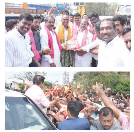
ఘనంగా శ్రీటీలర్ కు చౌటుప్పల్ స్వాగతం పలికిన డి.టి.ఎస్ నాయకులు కార్యకర్తలు దృశ్యాలు. -చౌటుప్పల్, ఫిబ్రవరి 26