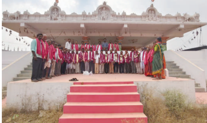
మహేశ్వరం ఫిబ్రవరి 26

కురుమ సంఘం అధ్యక్షుడిగా జోరల శ్రీశైలం కురుమ