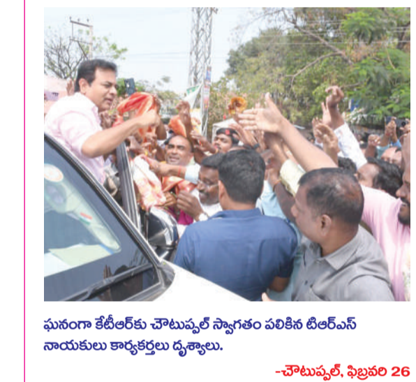
ఘనంగా శ్రీటీలర్ కు చౌటుప్పల్ స్వాగతం పలికిన డి.టి.ఎస్ నాయకులు కార్యకర్తలు దృశ్యాలు. -చౌటుప్పల్, ఫిబ్రవరి 26

పొలం పనులు కోసం పొయ్యెటప్పుడు బుడ్డదాన్ని వెంట తీసుకునిపో... మరచి పోయినావో కామాంధుల కాటుకు బల్ల పోతుంది జాగ్రత్త మహిళా..! మహిళా చిరునవ్వుల చాటున కన్నీటిచుక్కలు ఎవరికి తెలుసు...! కూలి నారికి పొయ్యెటప్పుడు చీడ పురుగుల బారిన పడకుండా నిండు వస్త్రధారణతో వెళ్ల... మరచి పోయినావో మట్ట మట్టి చిత్రపథ చేస్తారు జాగ్రత్త మహిళా..! మహిళా చిరునవ్వుల చాటున కన్నీటి చుక్కలు ఎవరికి తెలుసు...! అంతా నావాళ్ళే అని గుడ్డిగా నమ్మకు మహిళా..! నీ వెనక గోతులు తీసివేసి నీ వాళ్ళే అని తెలుసుకో మహిళా..! మహిళా చిరునవ్వుల చాటున కన్నీటి చుక్కలు ఎవరికి తెలుసు...! సహజంలో ఉన్న కొంత మంది గురించి మాత్రమే వారు మంచిగా ముఠాతారు అని ఆశిస్తు... తరలిపో తరలిపో.. చీకటి నుంచి వెలుగుకు తరలిపో.. కంటేలువి కాపు.. పులిలా మారిపో.. వెంటాడే ఒడిదుడుకుల పుష్పాలతో యుద్ధానికి తరలిపో..! ఓ మహిళా మీకివే మా వందనాలు. కంటిపాపలా కాపాడే 'స్రీమార్తికి వందనాలు